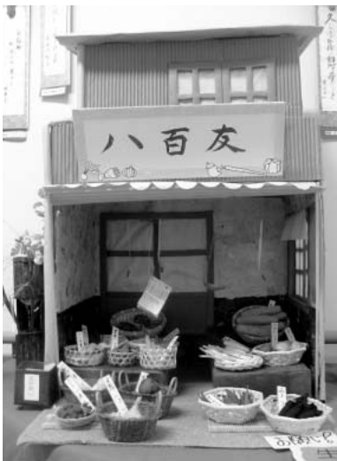
フェルトで作った お野菜が勢揃い