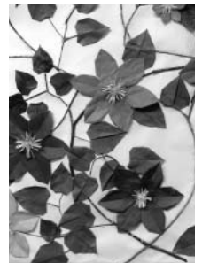
てっせん 共同製作

芸術の秋を迎え、今年も11月1日より作品展を催しました。利用者の皆さんの心のこもった力作が揃いました。また文化月間にちなみ、民謡や琴の演奏など、たくさんの方のボランティアさんの来訪があり、にぎやかで楽しいひと月でした。その一部をご紹介します。