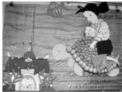
浦島太郎 共同製作