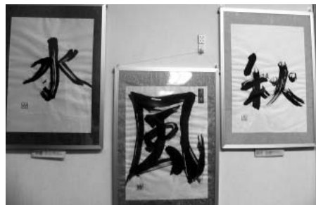
広告の紙で作った筆で書きました