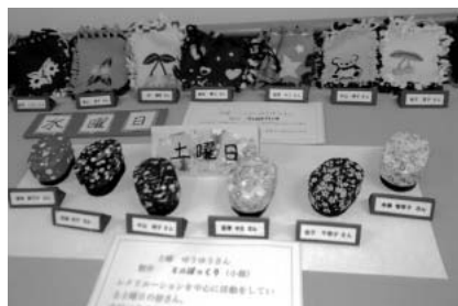
フェルトバッグとぽっくり