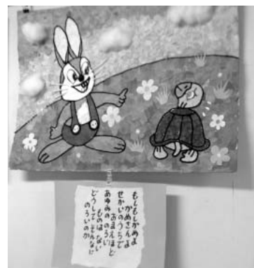
共同作品 日本昔話 「うさぎとかめ」