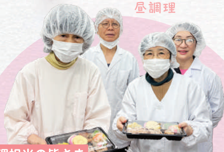
調理担当の皆さま