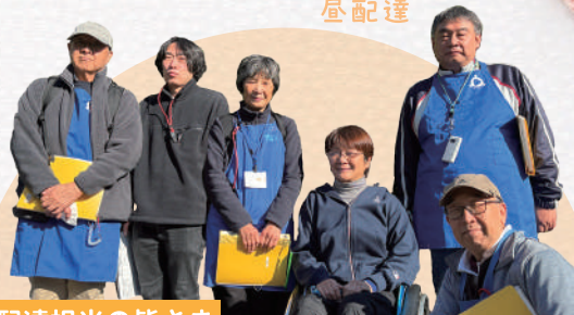
配達担当の皆さま