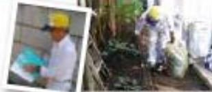
報告書を記入して終了です