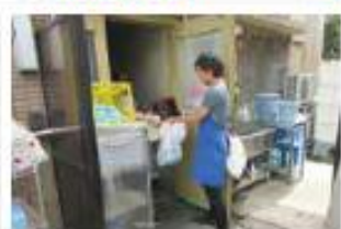
回収したお弁当箱を洗浄へ