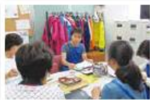
配達ルートの確認