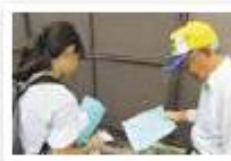
職員・協力会員と作業の確認