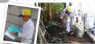
報告書を記入して終了です