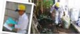
報告書を記入して終了です