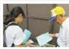
職員・協力会員と作業の確認