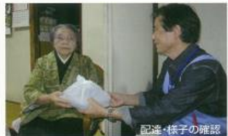
配達・様子の確認