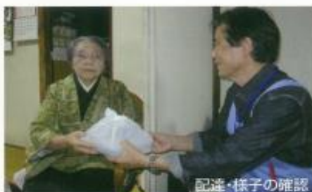
配達・様子の確認