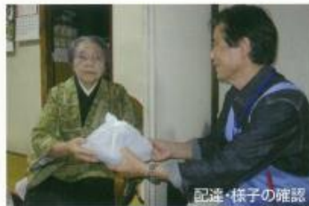
配達・様子の確認